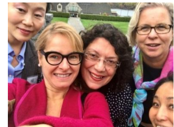
Réunies à Bar Harbor, des représentantes de la Corée, du Canada, de l'Allemagne, de la France et du Japon