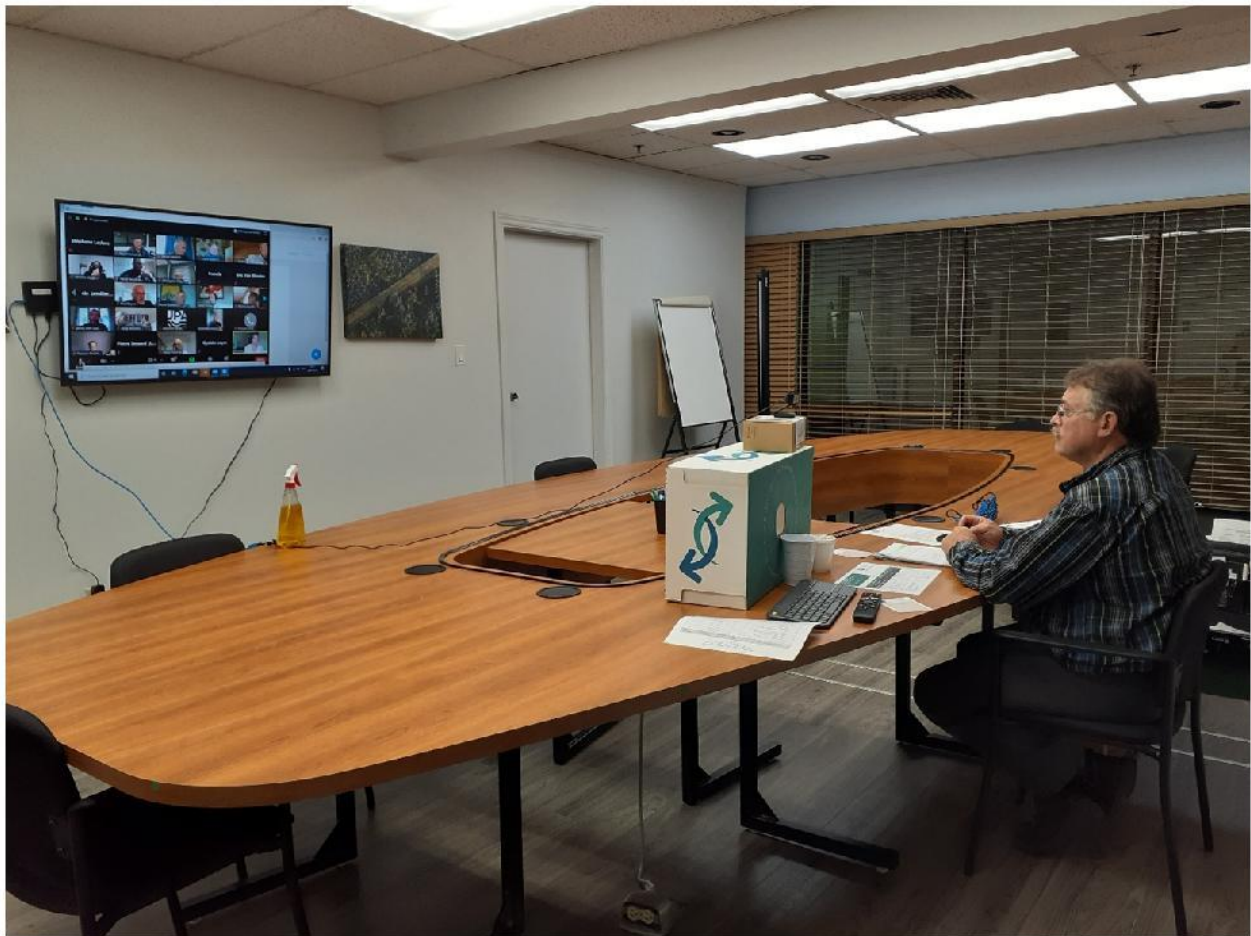
VISIOCONFÉRENCE AVEC L'UPA PAR ZOOM