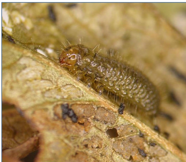
Figure 1. Larve de galéruque de l'airelle

Le dépistage des insectes a débuté durant la semaine du 9 mai. Les insectes observés étaient peu problématiques et il s'agissait principalement de charançons, de chenilles et de galéruques (Figure 1). La première capture de larve d'altise (Figure 2) a été réalisée le 24 mai, ce qui est un peu plus hâtif que la normale. Puisque peu d'altises ont été capturées cette année, pratiquement aucune application d'insecticide n'a été réalisée.