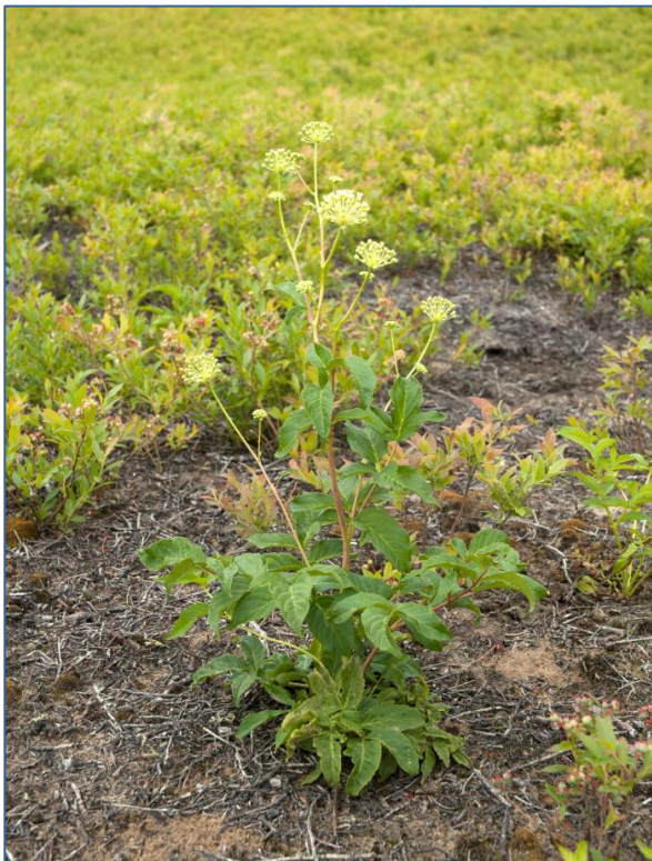
Figure 3. Aralie hispide

Au niveau des températures, elles se sont situées dans les moyennes de saison, sans grand épisode de chaleur ou de sécheresse prolongée. Les précipitations étaient dans les normales de saison, notamment pour la première moitié de l'été.