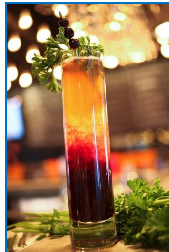
Bluenose aux bleuets sauvages du Québec par Patrice Plante

Vous y trouverez les perspectives pour la saison de commercialisation 2013-2014, ainsi que le bilan de la saison 2012-2013.