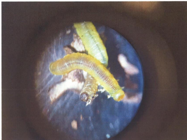
Larve de tenthrède du bleuet

Plusieurs espèces de tenthrèdes peuvent attaquer le bleuet nain. Ce sont des insectes communs et, généralement, les populations sont à des niveaux trop bas pour causer des dommages sérieux. Des infestations sporadiques ont toutefois été rapportées au Maine et en Nouvelle-Écosse. Les infestations sont, la plupart du temps, très localisées dans un champ et ont tendance à se produire durant l'année de la récolte. Les larves se nourrissent de la mi-mai à la mi-juin, puis tombent au sol et s'enroulent dans un cocon, du début juin à la fin juin.