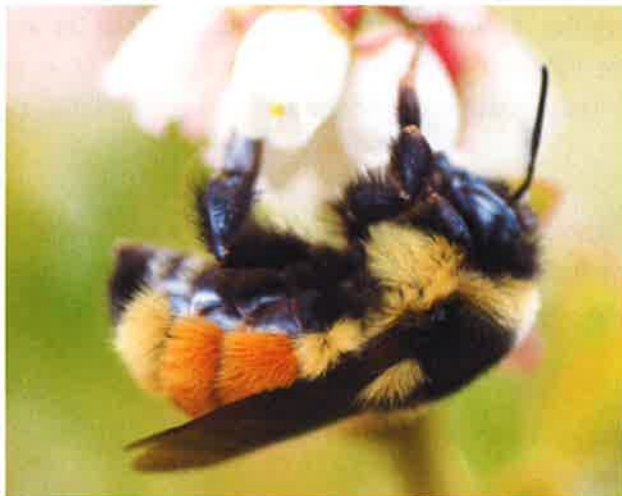
Bombus ternarius – © Joseph Moisan-De Serres