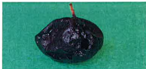
Figure 2. Fruit avec présence de la mouche du bleuet