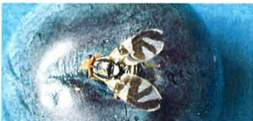
Figure 1. Mouche au stade adulte

La mouche du bleuet (Blueberry Maggot, Rhagoletis mendax Curran) (Figure 1) est un insecte menaçant pour l'industrie du bleuet sauvage, car ses larves infestent et endommagent les fruits (Figure 2). Elle mesure environ 4,5 mm (0.2 pouce) de long et l'envergure de ses ailes est d'environ 8 mm (0.3 pouce). L'aide d'un spécialiste et d'un examen en laboratoire est nécessaire pour l'identifier, car elle est difficile à distinguer de deux autres espèces similaires.